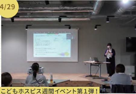
こどもホスピス週間イベント第1弾!

シブリングサポーター研修ワークショップ 病気や障がいのある子どもの「きょうだい」について想いを馳せ応援団を増やす研修では、学びが沢山ありました。