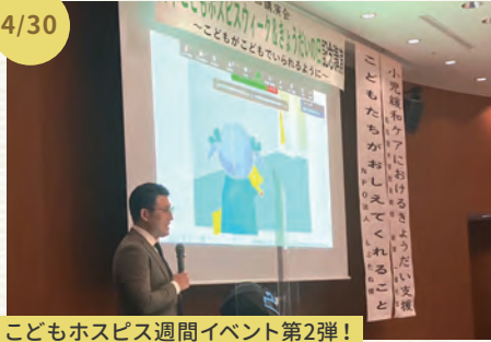
こどもホスピス週間イベント第2弾!

講演会「こどもがこどもでいられるように」 仮施設「くまさんち」の報告、小児緩和ケアにおけるきょうだい支援についての講演があり、その後は参加者で活発な意見交換が行われました。